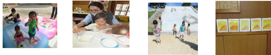
プール遊び クッキング 園庭遊び パステルアート

今年度もみなさんと一緒に親子で集い、作って、食べて、笑顔いっぱいになる楽しい企画をと考えていますのでドンドンアイデアやご意見をお聞かせください