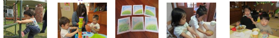
園庭遊び 粘土遊び パステルアート カレー作り カレーパー テイー